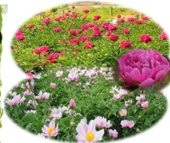
畑一面のしゃくやくは圧巻