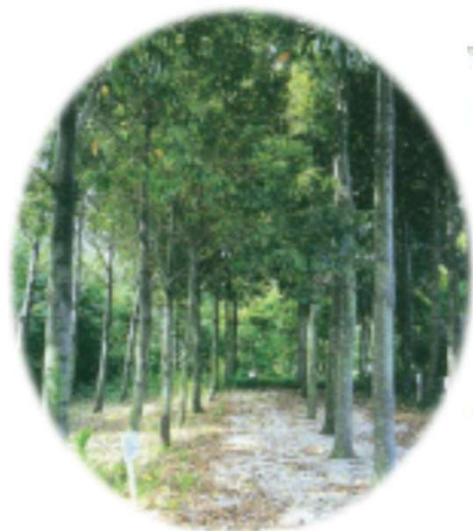
日本ではめずらしいニッケイの森 一見の価値あり